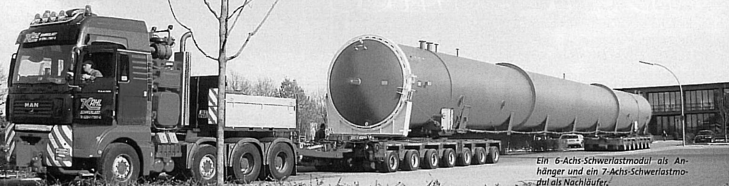
Ein 6-Achs-Schwerlastmodul als Anhänger und ein 7-Achs-Schwerlastmodul als Nachläufer.

Drei spannende Nächte liegen hinter der Mannschaft von Kahl Schwerlast. Im Auftrag der Schwerlast Spedition Hamburg transportierte das Unternehmen zwei Autoklaven von Coesfeld nach Krefeld.